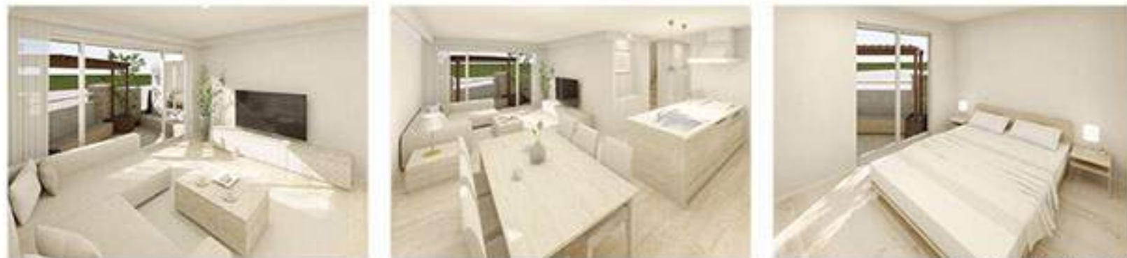
※すべて完成予想パースです