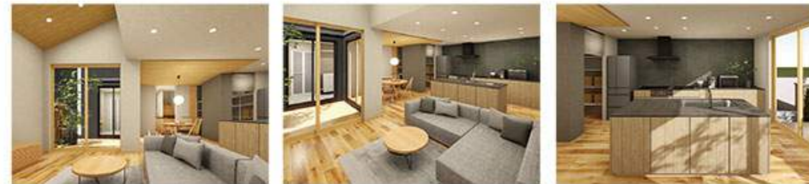
※すべて完成予想パースです