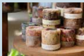
フラワーキャンドル